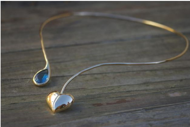
Réalisation de Claire Chiffolleau stagiaire à l'Atelier Clarat